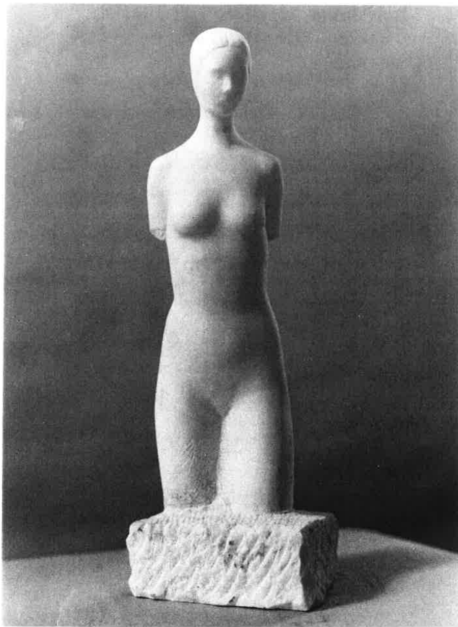
Desnudo (40 x 14 cm. - Marmol)