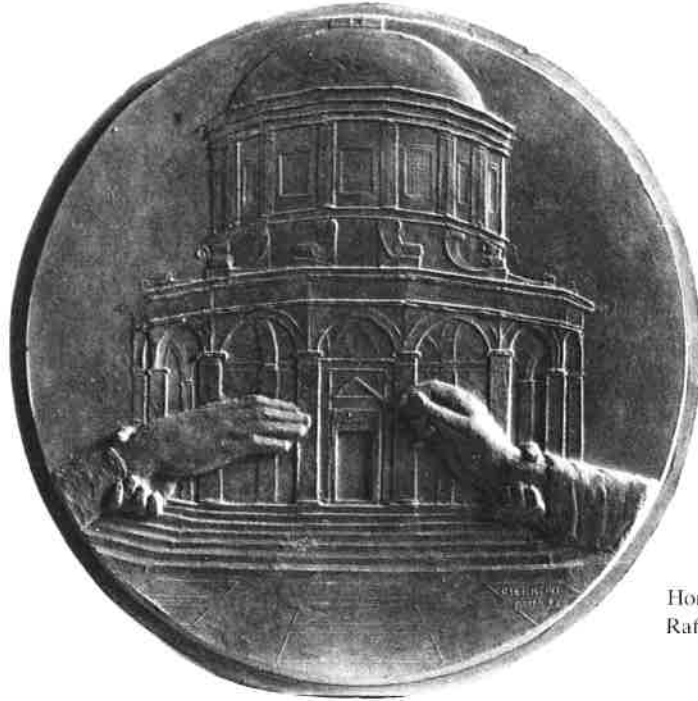
Homenaje a Rafael