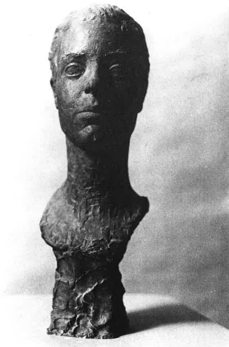
Mujer romana (55 x 20 cm. - Escayola patinada)